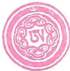
Kalu Rimpoche Karma Ngédeun Tènpé Gyaltsèn